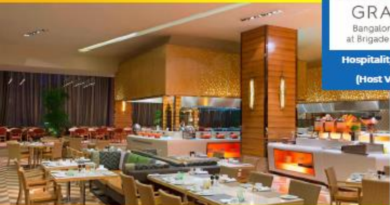
Feast - All day dining restaurant