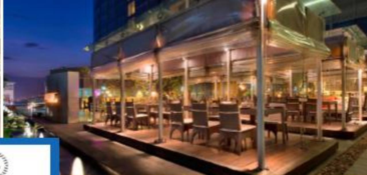
Persian Terrace - Middle-Eastern fine-dining restaurant