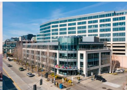
Operating WTC Dubai