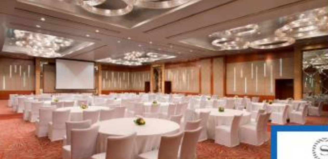
Grand Ball Room